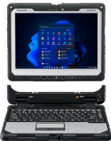
Clavier vendu séparément