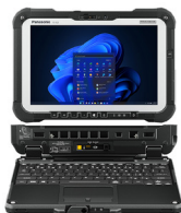
Clavier vendu séparément